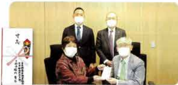
令和4年3月23日、贈呈式が行われました。